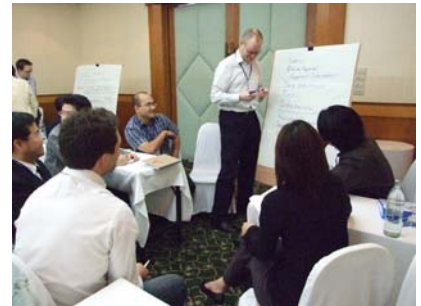
แบ่งกลุ่มแสดงความคิดเห็น เรื่อง Medical Imaging