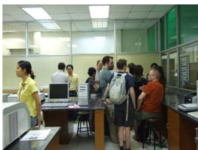
ศูนย์วิจัยและฝึกอบรมสาขาโรคทางไฟฟ้าของหัวใจ ภาควิชาสรีรวิทยา คณะแพทยศาสตร์ มช.