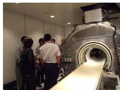
ห้องปฏิบัติการ Magnetic Resonance Imagine (MRI) คณะเทคนิคการแพทย์ มช.